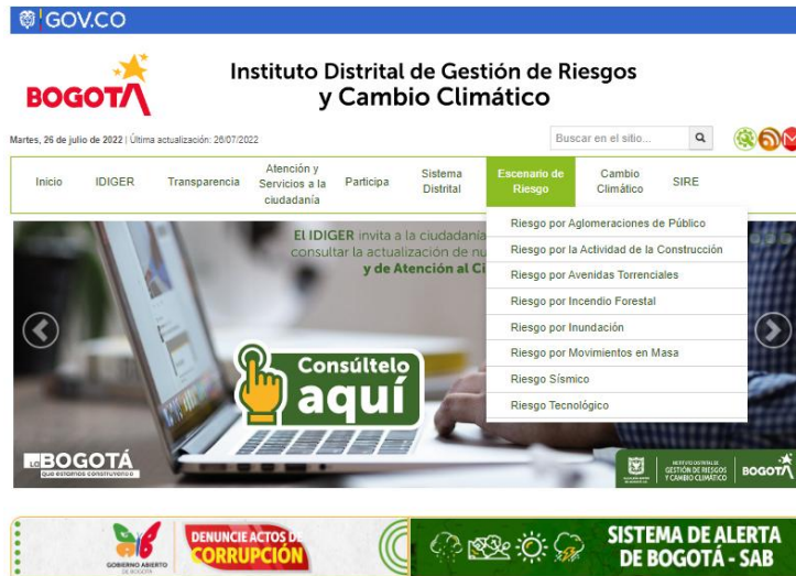
Imagen. Ingreso a la página web de escenarios de riesgos – IDIGER.

De acuerdo con lo anterior, y conforme su solicitud dentro de cada escenario se encuentran las recomendaciones a acciones a seguir por parte de las comunidades donde se presentan para cada uno de estos según sus particularidades. Por ejemplo, para el caso del riesgo a sísmico se tiene lo siguiente: