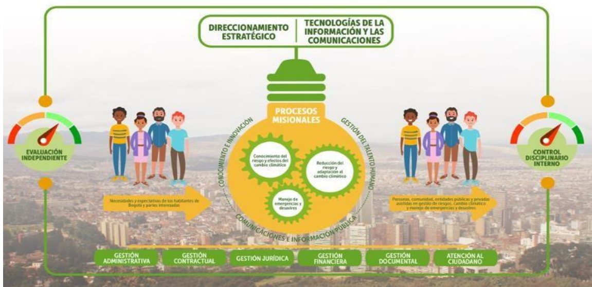
Mapa de procesos IDIGER