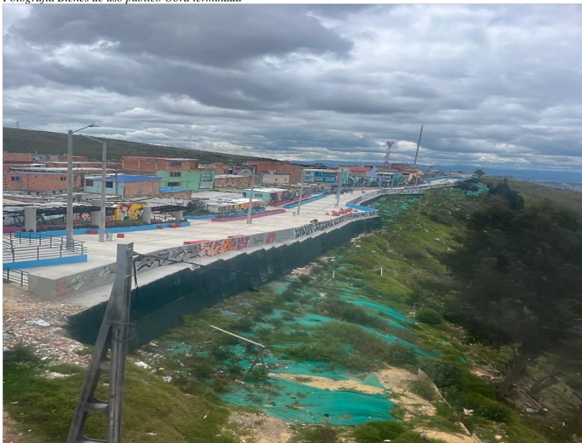
Fotografía Bienes de uso público Obra terminada

en cuenta que la EAAB, no se le ha recibido al contratista la obra, toda vez que está en proceso el tema de hidrosanitarias, para su conexión al sistema de la red existente, igualmente la empresa ENEL, está en proceso de conexión al sistema de energía de Bogotá, en el transcurso del proceso de liquidación las anteriores entidades han realizado las visitas y observaciones pertinentes, por lo tanto no hay recibo a satisfacción por parte del IDGER a la interventoría. Una vez culminado este proceso se efectuará la liquidación de los contratos de obra e interventoría y la obra será objeto de entrega a la Secretaría Distrital del Hábitat, según convenio 484-2019 y la SDTH realiza la entrega al DADEP.