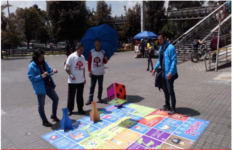
7 juegotecas educativas en calidad del aire y salud