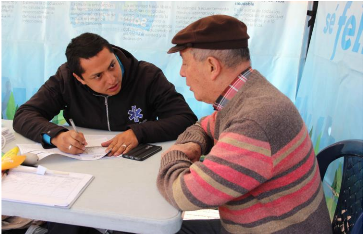
Valoración de riesgo cardiovascular en 26 puntos “Cuídate, Se Feliz”