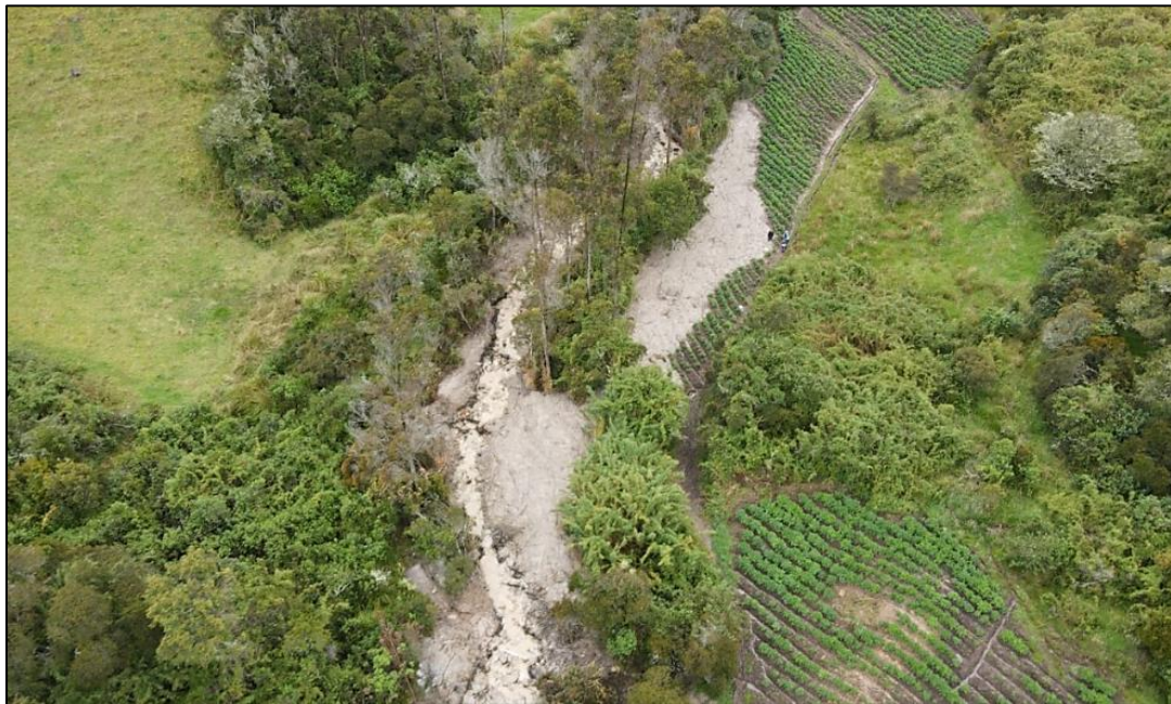
Ilustración 2. Evento por Avenida Torrencial - Qda. Guanga - Vda. Olarte – 3 de Agosto de 2021