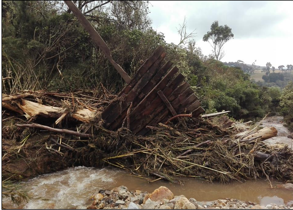
Ilustración 1. Evento por Avenida Torrencial - Qda. Piedra Gorda- Vda. Curubital - 15 de Noviembre de 2020