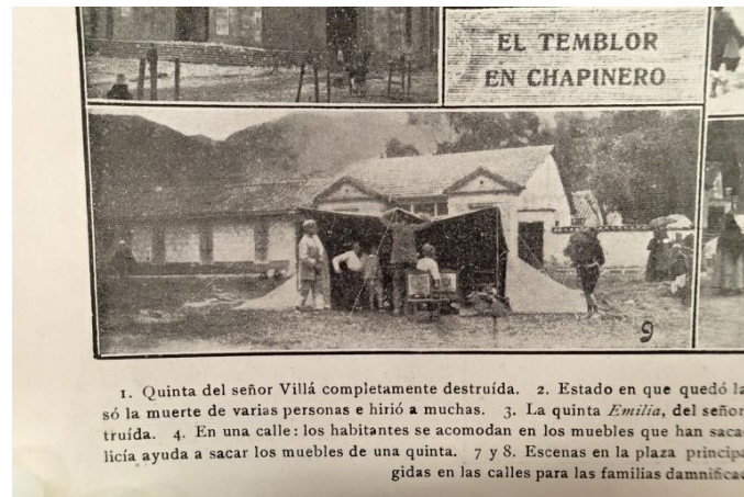
Toldas de campaña erigidas para los damnificados (Revista "El Gráfico", septiembre 1 de 1917)

Por otra parte, el miedo a que se repitieran los temblores y el estado de ruina en que se encontraba la ciudad hizo emigrar a muchas familias (aproximadamente 30.000 personas) a la Sabana y a otras poblaciones cercanas. Se levantaron campamentos en donde se refugiaron tanto damnificados como personas temerosas de permanecer en sus viviendas.